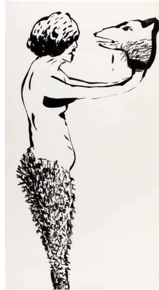
İnci Eviner, "Meydan Okuma", 2005, kağıt üzerine mürekkep. Sanatçı Koleksiyonu

"Desen nerdeyse doğal bir süreç olarak hep, hayatımın önemli bir parçası oldu."