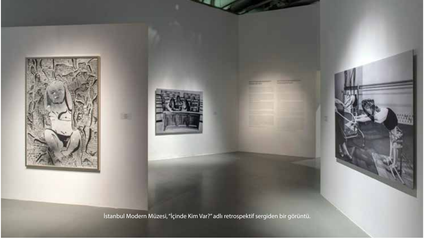
İstanbul Modern Müzesi, "İçinde Kim Var?" adlı retrospektif sergiden bir görüntü.

hoca olarak deneyimlerimi paylaşmak konusunda daha hevesleyim. Bu sergiyle genç kuşak sanatçılara cesaret verdiğimi ve sanat tarihi yazılımı konusunda da farklı bir kapı araladığımı düşünüyorum.