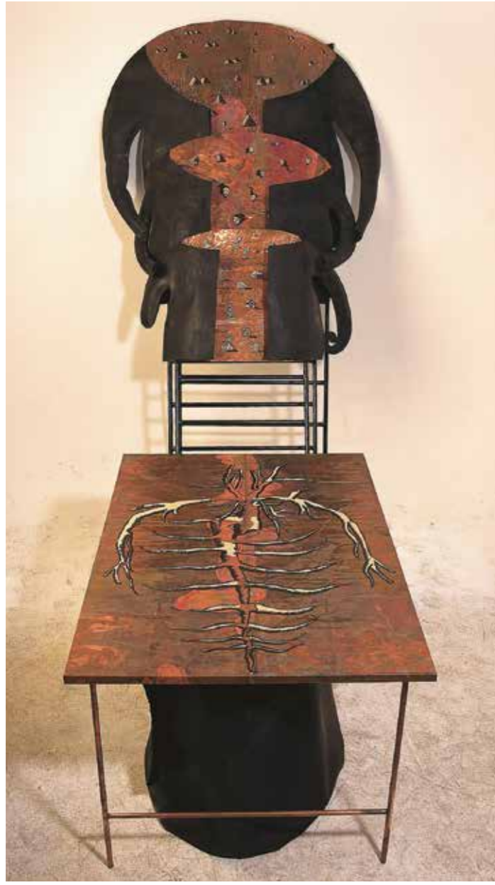
İnci Eviner, "Derisiz", 1996, bakır, deri, akrilik ve at kılı. Sanatçı Koleksiyonu. GÖNDERİ desteğiyle.

zamanda kızlar için bir tehdide dönüşüyor. Çünkü bu dramın imgeye dönüşmesi bizim onunla kuracağımız ilişkiyi sorunlu hale getiriyordu. Genellikle yapıtlarımda gösterilen ile onun sakladıkları arasında bir gerilim yaratmaya çalışıyorum. Söylenenler kadar söylenmeyenlerin, görünenler kadar görünmeyenler arasında dolaşmaya çalışıyorum.