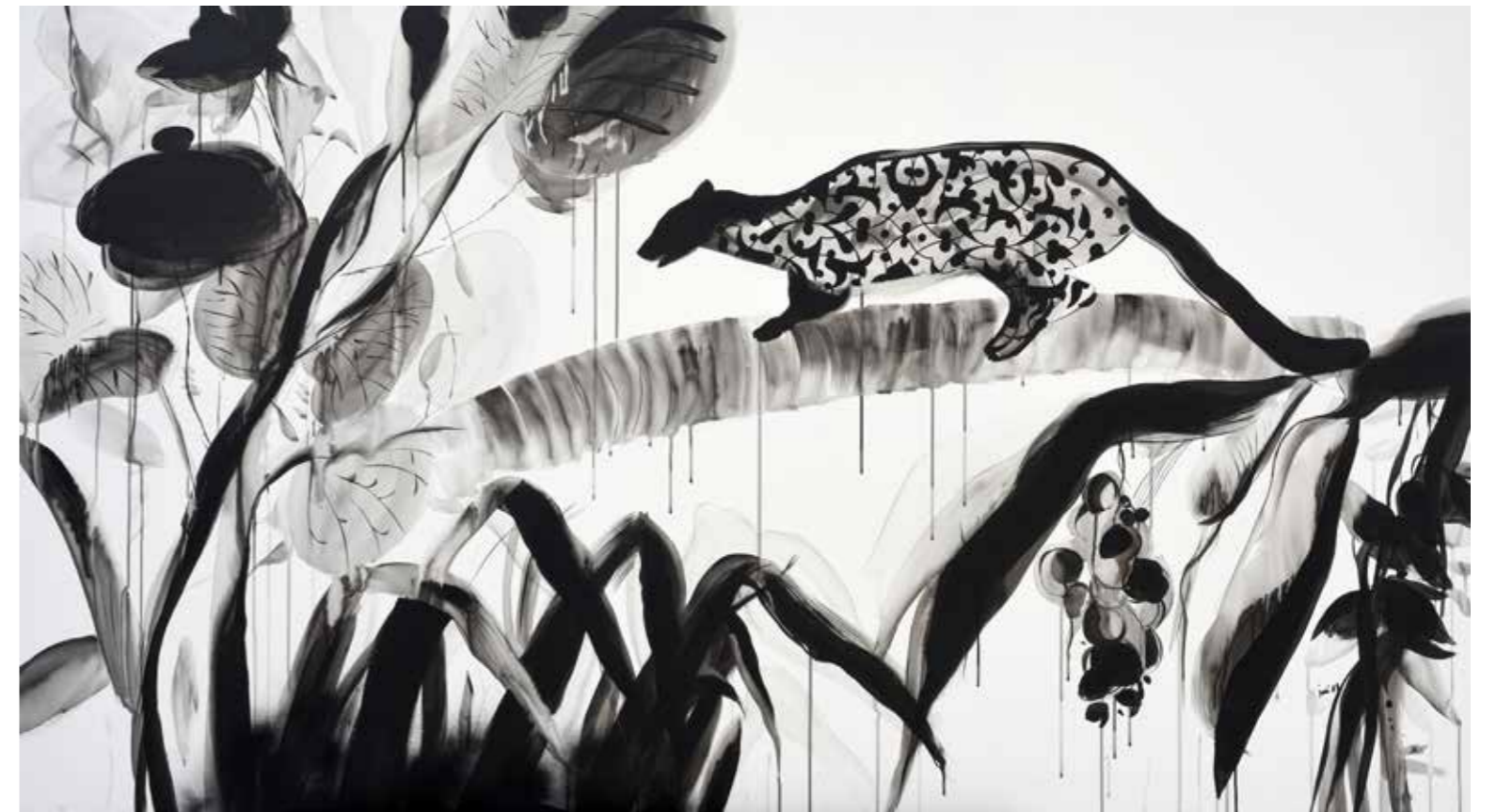
İnci Eviner, "Soyut Figüratif Kompozisyon", 2007, tuval üzerine akrilik. Antik A.Ş. a 293, müzayede 132.500 TL. (Sanatçı müzayede rekoru)