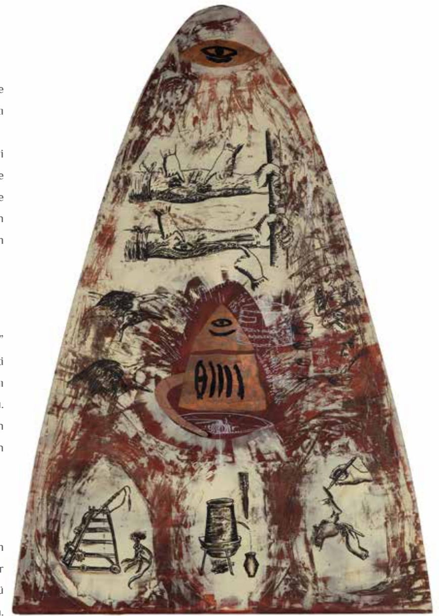
İnci Eviner, “Coğrafya”, 1993, kontrplak üzerine akrilik ve bakır. Sanatçı Koleksiyonu.

“Evden Kaçan Kızlar, 2015” de Drawing Center NYC’den aldığım sergi teklifi üzerine, SAHA’nın üretim desteği ile gerçekleştirdiğim bir video. Yeni bir hayat umuduyla evini terk eden kızların içine düştüğü çıkmazı kendi görsel ve sanatsal anlayışımla ifade etmeye çalıştım. Kendi etrafında dönen kamera bir yandan hareketi kaydederken aynı