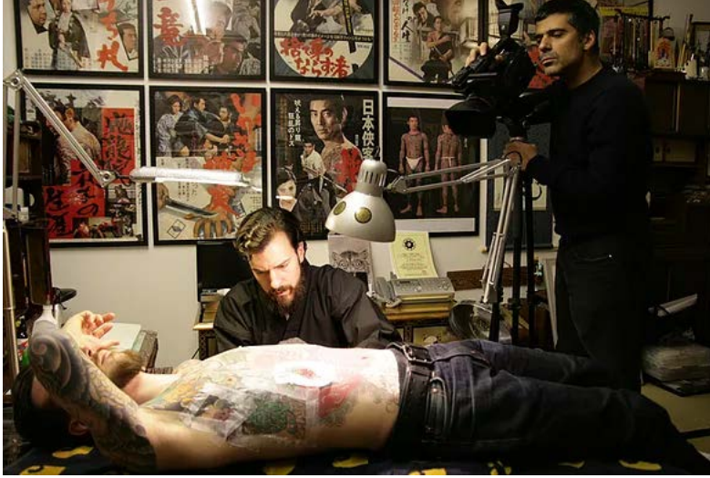
Ali Kazma, Dövme (Tattoo), 2013, Resistance serisinden, HD Video

ile, Kaligrafi (2003) ve Vehbi Koç Vakfı desteğiyle 2011'de ürettiği Kâtip isimli bir diğer çalışması buluşturuluyor. İnsanın emek ve nezaket ile ilişkisini estetize eden bu işler, zaman, kalıcılık, değer ve tekil-çoğul ilişkisi üzerine gerek fiziksel, gerekse metafizik ebatta türlü soru ve yanıt olasılıklarını bünyesinde taşır bir yap-boz bereketi ihtiva ediyor. Kazma, birbirimize fısıldayarak, izleyicileri izleyerek gezdiğimiz sergide eserleri aynı çatı altında, belli bir 'algı kurgusu' nezdinde, 'bir araya getirme' sürecinin kendisi ve küratörler için hiç de kolay olmadığını altını çiziyor. Turumuzda, Kazma da ara ara heyecanlanarak, işlerin tamamen biricik, anlık bir kurgu ile birbirlerine nasıl bir imge ve içerik paslaşmasında bulunduğunu keyifle anlatıyor.