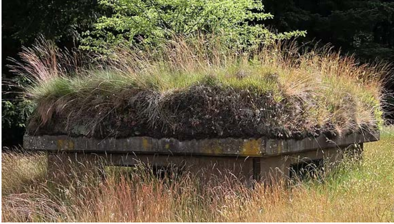
Ali Kazma, Boşluk (Absence), 2011, HD Video

Etkinlikte Jeu de Paume desteğiyle Fransa'da hazırladığı ve arkeolojik lezzetteki Geçmiş (Past, 2012) isimli eserini de bizlerle paylaşan sanatçı, 2017 tarihli Kuzey (North) isimli videosunda ise, eski SSCB kültürünün tam anlamıyla 'heykel'i sayılabilecek, 1936'dan 1991'e kadar 'yaşamış' Spitsbergen adlı stratejik enerji yerleşkesi Pyramiden adasına geri dönüş yapıyor. Medeniyetin, ister sağdan, isterse soldan gelsin, ardında neler bıraktığı ve bırakabileceği konusunda ürkütücü, 'gerçek zamanlı' bir tatbiki güzel sanatlar deneyimi bu. Bir kültür fosilinin buzdan portresi.