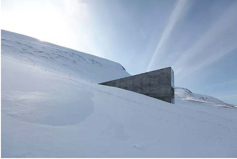
Ali Kazma, Kasa (Safe), 2015, Resistance serisinden, HD Video

Küratörlüğü Pia Viewling'e ait etkinlikte, Kazma'nın 2017'de ürettiği Elektrik , Kuzey ve Maden ile Çay Saati gibi eserleri görülebilirken, ortalama dört ila on beş dakika süren eserler, mekânı ziyaret eden enternasyonal izleyici kitlesinin büyük ilgisiyle karşılaşılıyor. Çalışmaları geniş mekânlarda art arda izleyen sanatseverler, Kazma'nın dünyanın türlü bölgelerinden aksettirdiği akar görüntülerin adeta içine düşerek, bambaşka âlemler arasında seyahate çıkıyor. Öyle ki, etkinliği çerçeveleyen beş salon ve bir balkon, serginin adına yaraşır bir duygu ile adeta alternatif bir yeraltı evreninin kavşak noktaları halini alıyor.