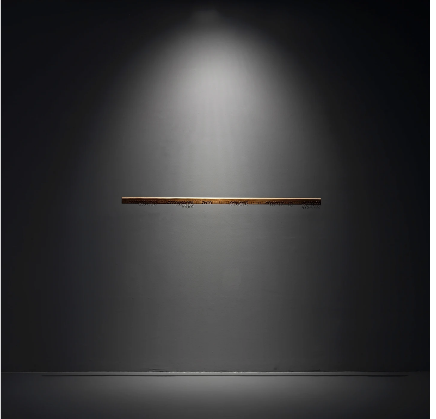
Cevdet Erek, Derisiz Cetvel Def II , 2023, Ahşap, metal, 5 x 150,5 x 1 cm

çepeçerçeve isminin de ima ettiği gibi, bu sergide "sarmalayıcı" ( immersive ) bir his var. Bu sarmalama jargonu son yıllarda çok pop bir jargona dönüştü, pop ve steril. Burada daha "kirli" bir şey var, kirli ve rastlantısal. Bu "sesle kuşatma" hamlesinin (mesela, derisiz deflerin) ardından nasıl bir fikir vardı? Bizi nereye davet ediyor bu işler? "Kirli"nin yanında "doğa", "akustik", "yakın" gibi kavramlar da geliyor aklıma. Yani, deflerin derilerinin çıkarılması, içine bir dinleyici girmesi ile icracı-icra ve dinleyen/maruz kalan arasındaki ilişkinin değiştirilmesi ve giriftleşmesi üzerine denemeler yapılıyor. Büyük defle de dinleyicinin tam kulaklarının çevresini 360 derece saran bir kasnağa sürekli çarpan metal halkaların seslerini, ki bahsettiğin güncel sarmalayıcı/ immersive sanat/deneyim dünyasının büyük bölümü dijital-elektrikli vericilerle ortaya çıkıyor- aracı olmadan duyduğumuz bir barışçıl gürültü deneyimi arzulanıyor. Bizi denemeye, kulak açmaya, orada olmaya davet ediyor sanırım, genelde de sadece dinleyici olmaya değil istersen yapan da olmaya. Bu yapma eyleminin merkezinde de derisiz deflerin, -elek kullanmaya benzer- döngüsel bir gündelik hayat jesti ile harekete geçirilmeleri yatıyor.