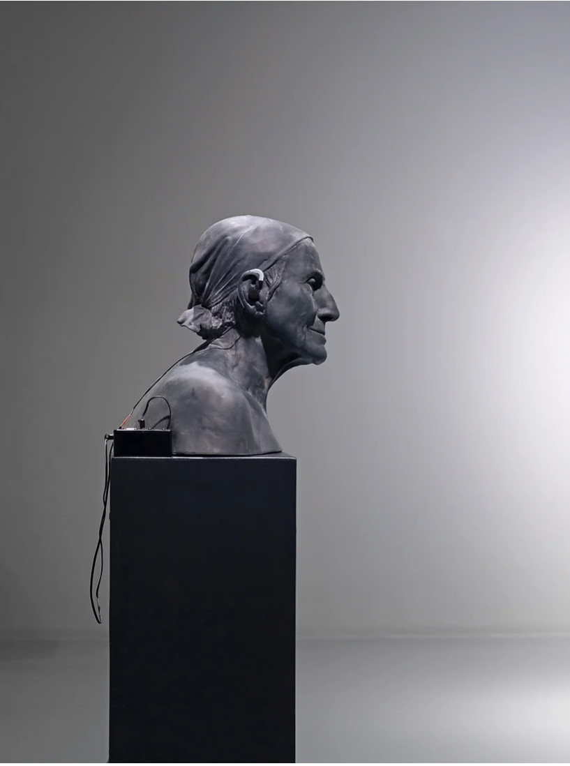
Cevdet Erek, Ana Kulağı II, 2023 Silikon, kontrplak, metal, karbon, fiber, abs plastik, servo kontrolör, bilyalı rulmanlar, güç adaptörü, 157 x 38 x 45 cm 3+1 A.P.