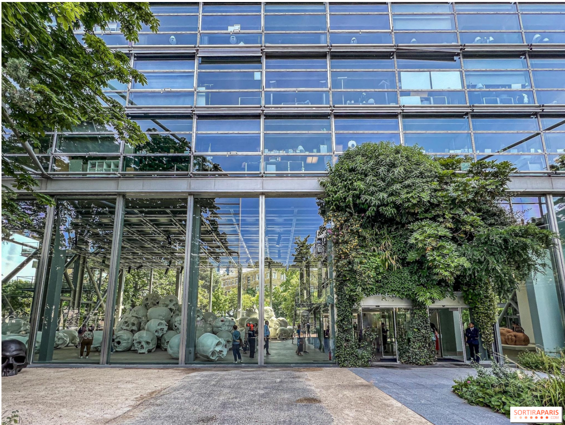
Fondation Cartier (Paris)

Découvrez Le souffle de l'architecte , une exposition contemplative et sensorielle présentée à la Fondation Cartier jusqu'au dimanche 21 avril 2024. La Fondation Cartier nous présente l'architecte indien Bijoy Jain, fondateur du Studio Mumbai. Dans une exposition surprenante et poétique, l'artiste nous entraîne dans son univers entre matière, nature et Homme.