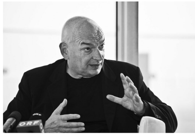
Jean Nouvel en 2009.

La Fondation Cartier organise des expositions temporaires mettant en lumière des artistes contemporains de diverses disciplines et origines. Elle soutient également la création artistique en commandant des œuvres spécifiques et en offrant des résidences d'artistes. En plus des expositions, la fondation organise des conférences, des concerts et d'autres événements culturels, contribuant ainsi à la scène artistique parisienne et internationale. La Fondation Cartier pour l'art contemporain joue un rôle important dans la promotion de l'art moderne et contemporain , en soutenant les artistes émergents et établis et en offrant un espace où le public peut interagir avec des œuvres d'art innovantes et expérimentales.