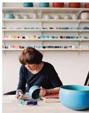
Alev Ebüziya Siesbye.

Les œuvres de Siesbye sont caractérisées par leur simplicité formelle et leur palette de couleurs souvent restreinte, axée sur les tons naturels et les finitions subtiles. Ses bols et ses vases, travaillés avec une précision méticuleuse, sont admirés pour leur forme parfaite et leur surface lisse et homogène. Cette attention portée à la forme et à la finition reflète l'influence des traditions céramiques à la fois orientales et scandinaves. Siesbye a exposé ses œuvres dans de nombreuses galeries et musées du monde entier, et ses créations font partie de collections prestigieuses. Elle est reconnue pour sa contribution significative à l'art de la céramique contemporaine, apportant une perspective unique qui transcende les frontières culturelles et artistiques.