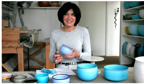
Alev Ebüziya Siesbye.

compétences artisanales traditionnelles, mais aussi de créer des bâtiments qui sont à la fois fonctionnels et esthétiquement beaux, faisant de Studio Mumbai un acteur influent dans le monde de l'architecture contemporaine.