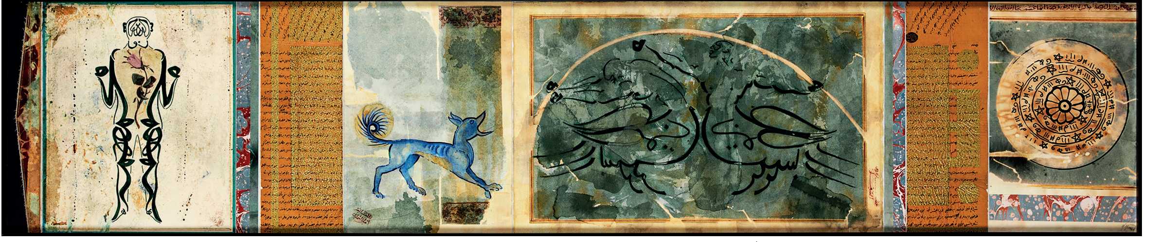
Murat Morova, İsimsiz , 2024. El yapımı kâğıt üzerine pigment, akrilik, sulu boya, çini mürekkebi, 37x175 cm