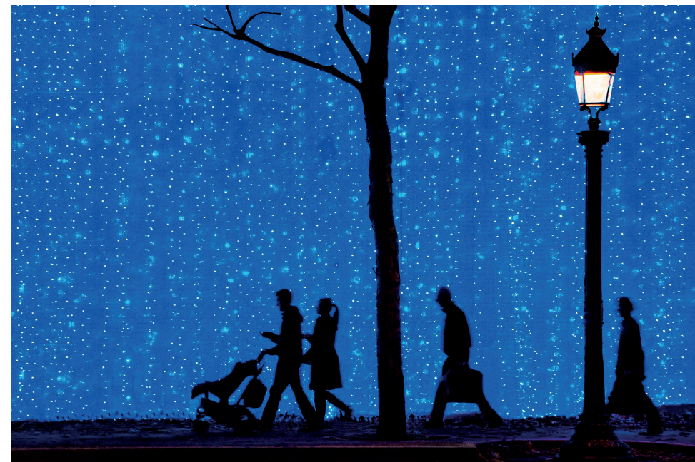
Mavi Şanzelize Bulvarı, Paris, Fransa. İstanbul Modern Sanat Müzesi Fotoğraf Koleksiyonu, 2009