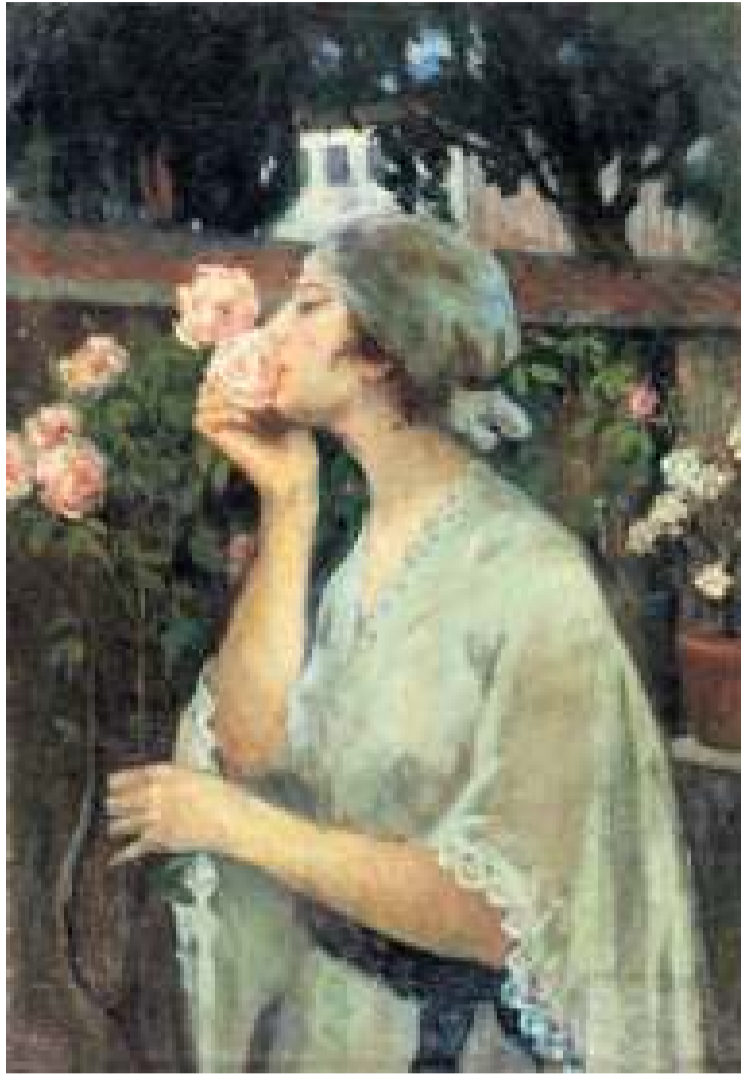
İbrahim Çallı, Gül Koklayan Kadın , 50x72 cm, tuval üzerine yağlı boya.

Türkiye İş Bankası sanat eserleri koleksiyonunun ilk eserleri 1939 yılında Devlet Resim Heykel Sergisi'nden alınmış. Hikmet Onat'ın Peyzaj-Ortaköy, Şevket Dağ'ın Enteriyör-Rüstempaşa Camii,